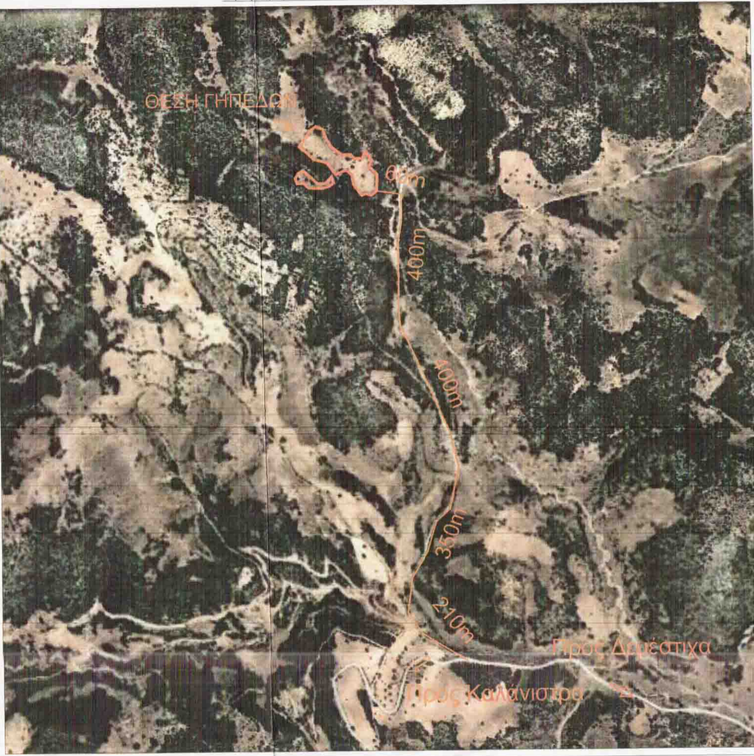
ΑΠΟΣΠΑΣΜΑ ΧΑΡΤΗ Γ.Υ.Σ. Νο 6236 7 ΚΛ.1:5000