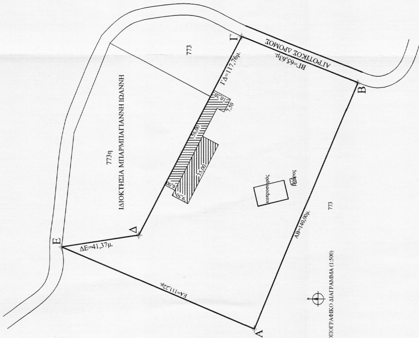
ΤΟΠΟΓΡΑΦΙΚΟ ΔΙΑΓΡΑΜΜΑ (1:5000)