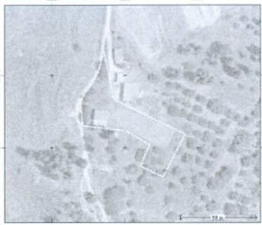
ΑΠΟΞΕΛΙΣΜΑ ΧΑΡΤΗ Γ.Υ.Σ. ΚΑΙΜΑΚΑΣ 1:5.000