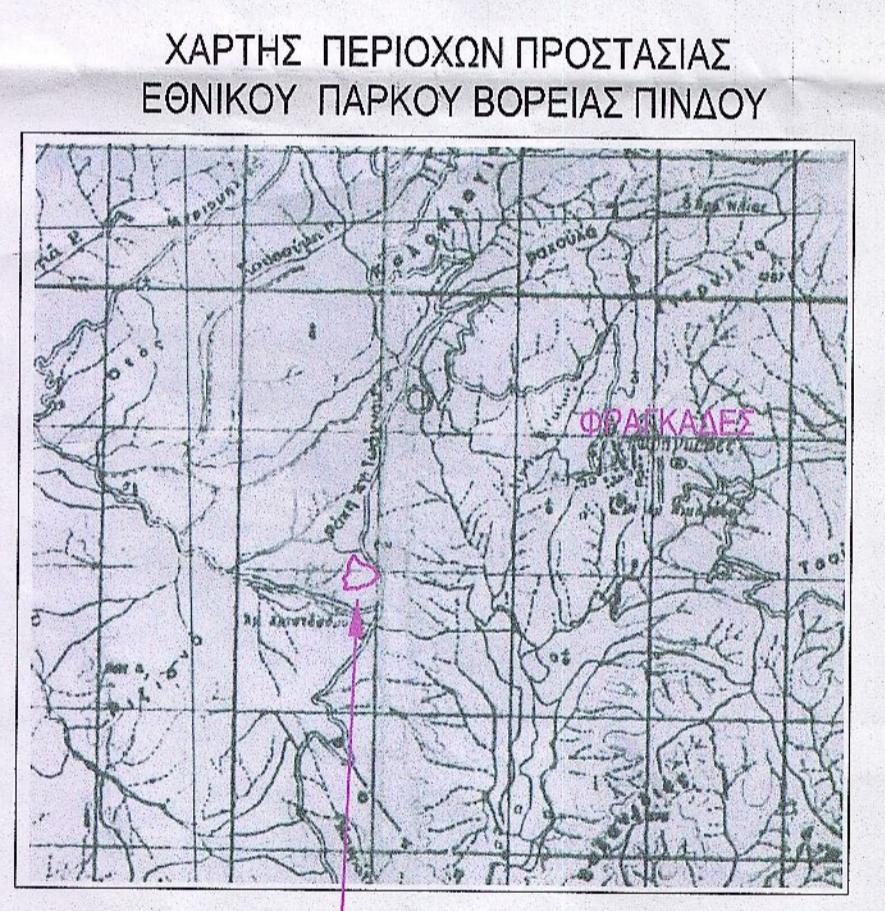
ΘΕΣΗ ΙΔΙΟΚΤΗΣΙΩΝ (ΠΕΡΙΟΧΗ ΕΝΤΟΣ ΤΟΥ ΠΑΡΚΟΥ, ΕΚΤΟΣ ΖΩΝΩΝ ΠΡΟΣΤΑΣΙΑΣ)