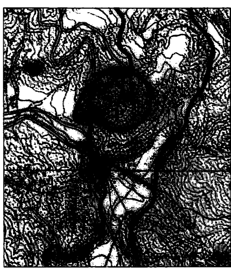
ΑΠΟΣΠΑΣΜΑ ΤΟΠΟΓΡΑΦΙΚΟΥ ΔΙΑΓΡΑΜΜΑΤΟΣ ΓΥΣ ΑΡΙΘΜΟΣ 6 305 / 4 ΚΑΙΜΑΚΑ 1:5000