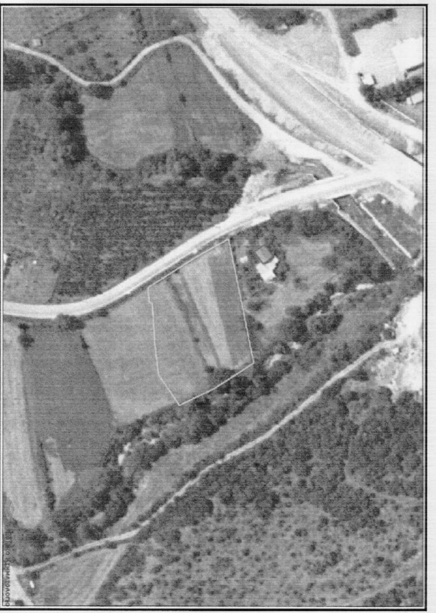
Αντίστροφα χάρτη ορθοφωτογραφία.