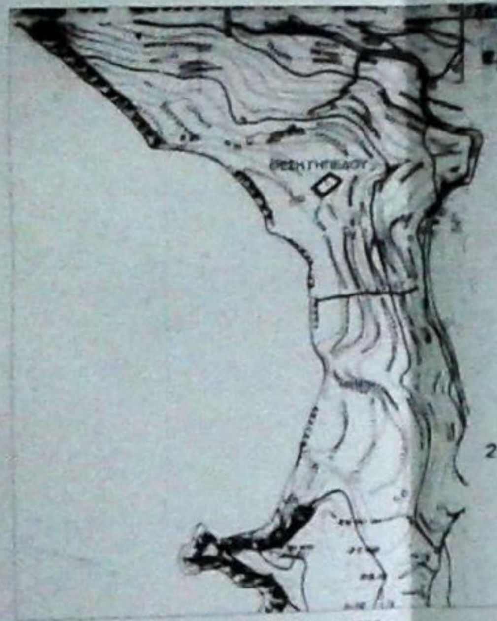
ΑΠΟΣΠΑΣΜΑ ΧΑΡΤΗ Γ.Υ.Σ. 1:5000 ΑΡΙΘΜΟΣ ΦΥΛΛΟΥ 6777_3