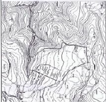
ΚΑΡΤΗ Γ.Υ.Σ. με Κωδικό 573-7