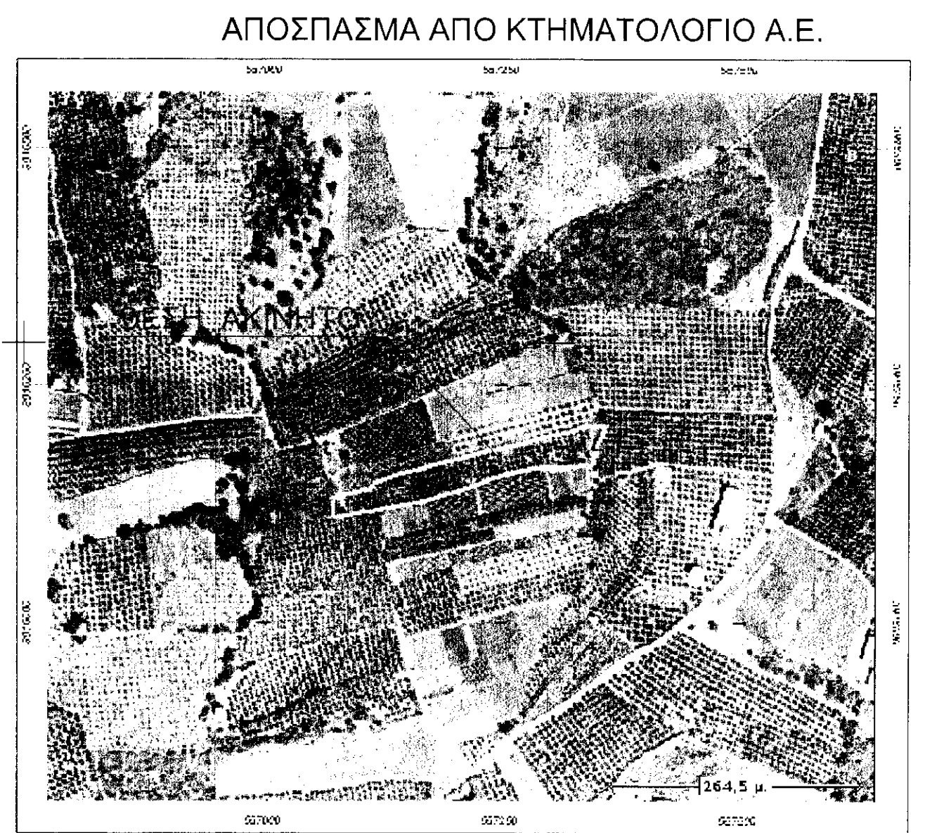
ΑΠΟΣΠΑΣΜΑ ΑΠΟ ΚΤΗΜΑΤΟΛΟΓΙΟ Α.Ε.

ΔΗΛΩΣΗ ΜΗΧΑΝΙΚΟΥ(Ν.651/77) Δηλώνω σύμφωνα με το νόμο για το γεωτεμάχιο με τα στοιχεία 1-2-3-4-5-6-7-8-9-.....-49-50-1 και εμβαδόν 8906.58 τ.μ. που βρίσκεται στη θέση "ΚΑΜΠΟΣ", της Δημοτικής Ενότητας Αρκαδίου του Δήμου Ρεθύμνης του Νομού Ρεθύμνης ότι: α) είναι άρτιο και οικοδομήσιμο καθώς προϋφίσταται ως έχει προ του έτους 1970(σύμφωνα με δήλωση του ιδιοκτήτη) και μετά από έγκριση των αρμόδιων υπηρεσιών Αρχαιολογίας-Δασαρχείου-Δ/ση Γεωργίας, β) βρίσκεται εκτός ορίων οικισμού Πρίνου, εκτός Ζ.Ο.Ε. και εκτός NATURA, γ) δεν εμπίπτει στις διατάξεις του νόμου 1337/83 περί εισφορών σε γή και χάρμα, δ) εντός αυτού δε διέρχονται εναέριες γραμμές μεταφοράς υψηλής τάσης της ΔΕΗ ή αγωγός φυσικού αερίου και ε) δεν εφάπτεται σε αυτό ρέμα. Ζη απόσταση του γεωτεμαχίου από τη θάλασσα είναι 1350 μέτρα.