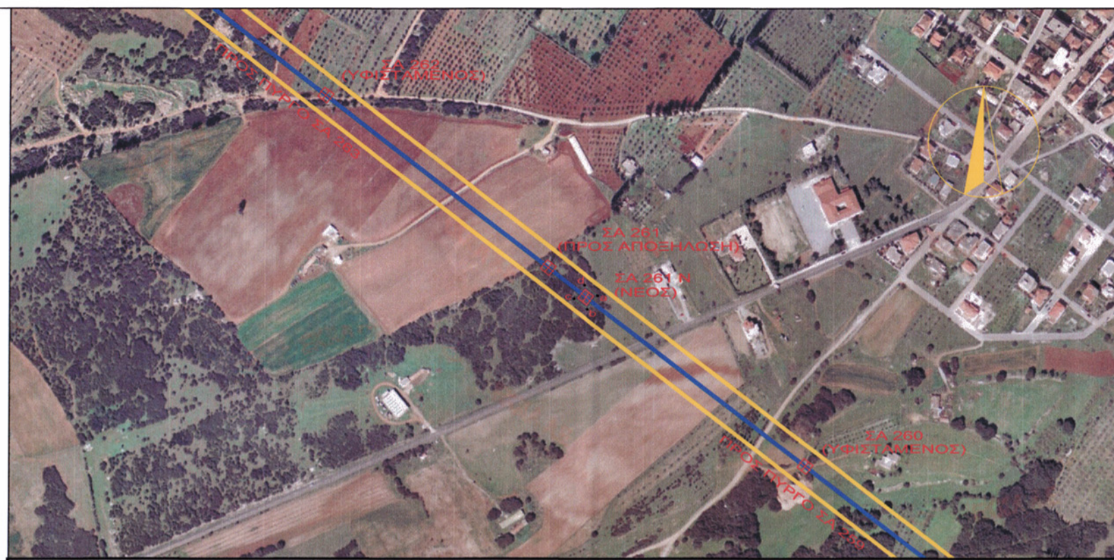
ΑΠΟΣΠΑΣΜΑ ΟΡΘΟΦΩΤΟΧΑΡΤΗ ΑΠΟ ΤΗ ΔΙΑΝΟΜΗ ΤΗΣ ΕΚΧΑ Α.Ε. - ΚΛΙΜΑΚΑ 1:5000