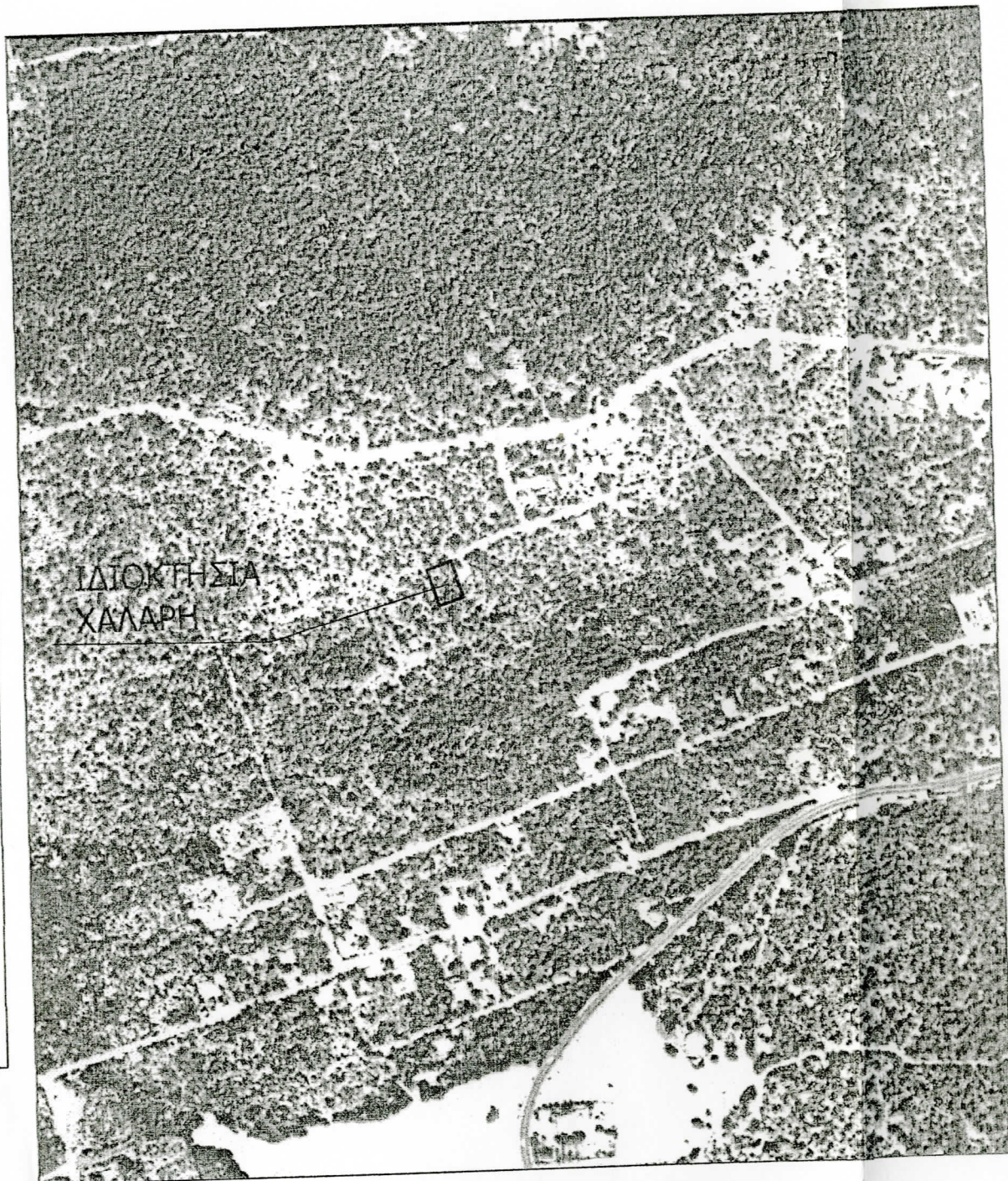
ΑΠΟΣΠΑΣΜΑ ΟΡΘΟΦΩΤΟΧΑΡΤΗ (ΚΛ. 1:5000)

τας τις συνέπειες βή τοποθέτηση της η ΓΥΣ 64 316 / υρώσεις που αρ. 6 του άρθρου 22 ση, οι διαστάσεις και ού 600,00 τμ. όπως μα πινακίδας ΓΥΣ / καν από τους