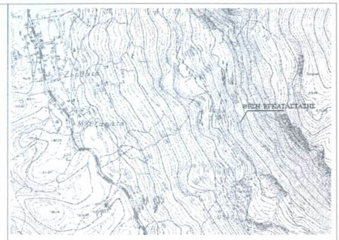
ΑΠΟΣΠΑΣΜΑ ΧΑΡΤΗ Γ.Υ.Σ. 6124/7 ΣΕ ΚΑΙΜΑΚΑ: 1:5.000

ΟΡΟΙ ΔΟΜΗΣΗΣ Π.Δ. 24-5-1985 / ΦΕΚ 270 Α / 31-5-1985 Ν. 3212/03 (ΦΕΚ 308 Α / 31-12-2003) -Ελάχιστο εμβαδόν γηπέδου - 4 000 μ 2 -Παρέκλιση 2 000 μ 2 και τα κτίσματα εκτός ζώνης και υφιστάμενα προ 24-4-1977 (σύμφωνα με τις διατάξεις του άρθρου 25 παρ. 6 του Ν.2508/97 και των άρθρων 2/2311/91/626-2-98 & 331/6209/38616-4-98) -Παρέκλιση 750 μ 2 και τα κτίσματα πρόσωτα > 10 μ. σε Εθνικούς, Επαρχιακούς, Δημοτικούς και Κοινοτικούς δρόμους και νεκροταφεία όπως είναι προ 12-11-1962 -Παρέκλιση 1 200 μ 2 και τα κτίσματα πρόσωτα > 20 μ. στους παραρτίδια δρόμους και πεζοδρόμια προ 12-9-1964 -Τα κτίσματα εκτός της ζώνης των πόλεων και των οικισμών, τα οποία ήταν, κατά την 24-4-1977, ήμια δημοσίου, του από 5-4-1977 Π.Δ. (ΦΕΚ 133 Δ) ελάχιστο εμβαδόν 2000 μ 2 . -Μέγιστο ποσοστό κάλυψης 10% -Μέγιστος συνολικός όροφος 0,20 -Ελάχιστη απόσταση από όρια γηπέδου > 15 μ. (εκτός παρεκκλίσεων) -Μέγιστος επιπεδωμένος καθετός ανέμος > 2 -Μέγιστο επιπεδωμένο ύψος 7,50μ. + 1,20 μ. στέγη -Μέγιστο επιπεδωμένο απόσταση κτιρίου 200 μ 2 (για κατοικία) σε γήπεδο μέτρη 4 000 μ 2 .