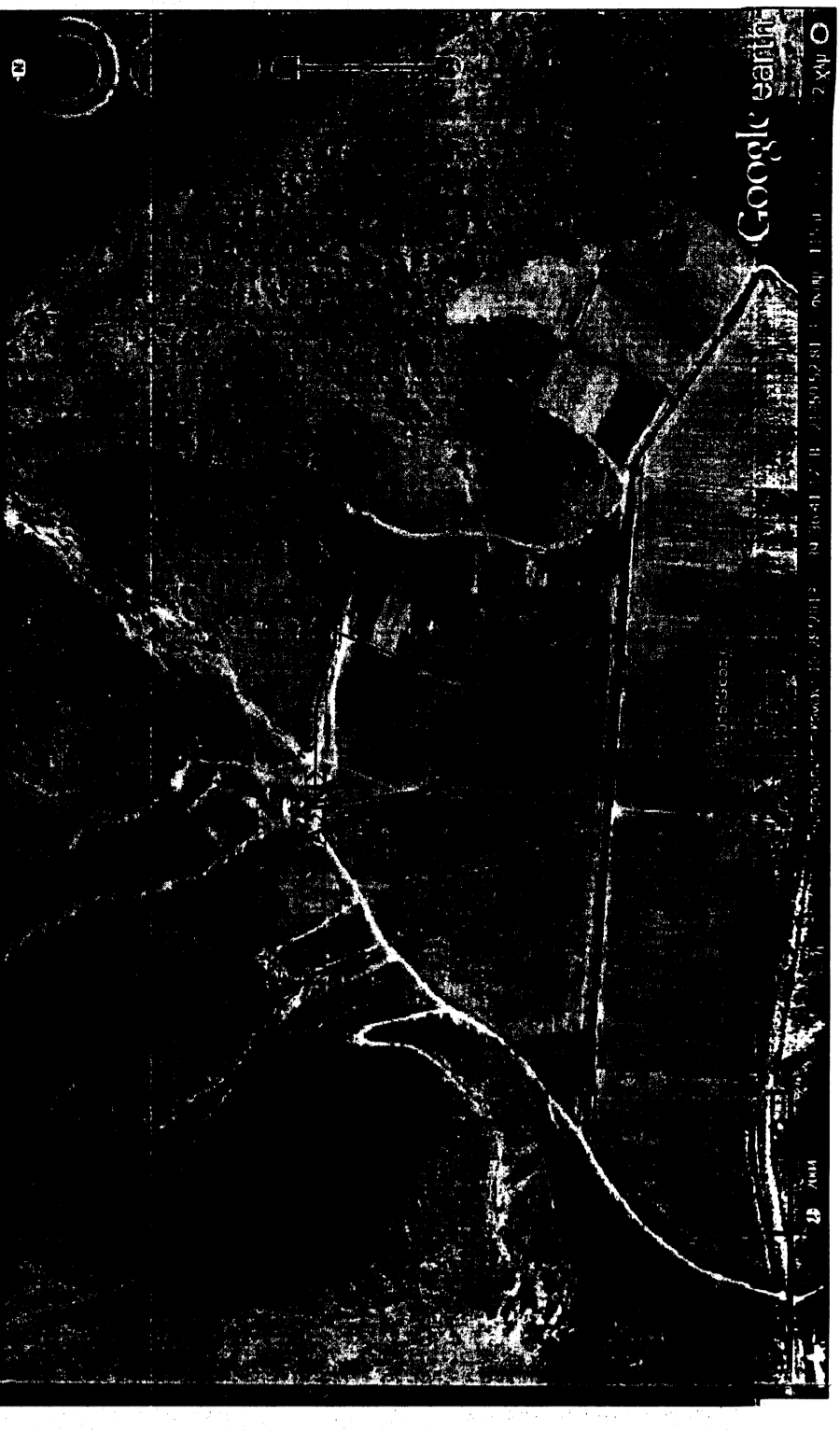
ΑΠΟΣΠΑΣΜΑ ΑΕΡΟΦΩΤΟΓΡΑΦΙΑΣ (GOOGLE)