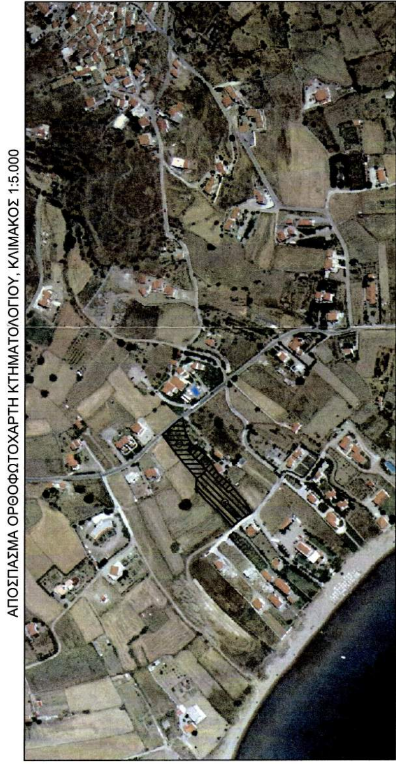
ΑΠΟΣΤΑΣΙΑ ΟΡΘΟΦΩΤΟΧΑΡΤΗ ΚΤΗΜΑΤΟΛΟΓΟΥ: ΚΑΙΜΑΚΟΣ 1:5.000