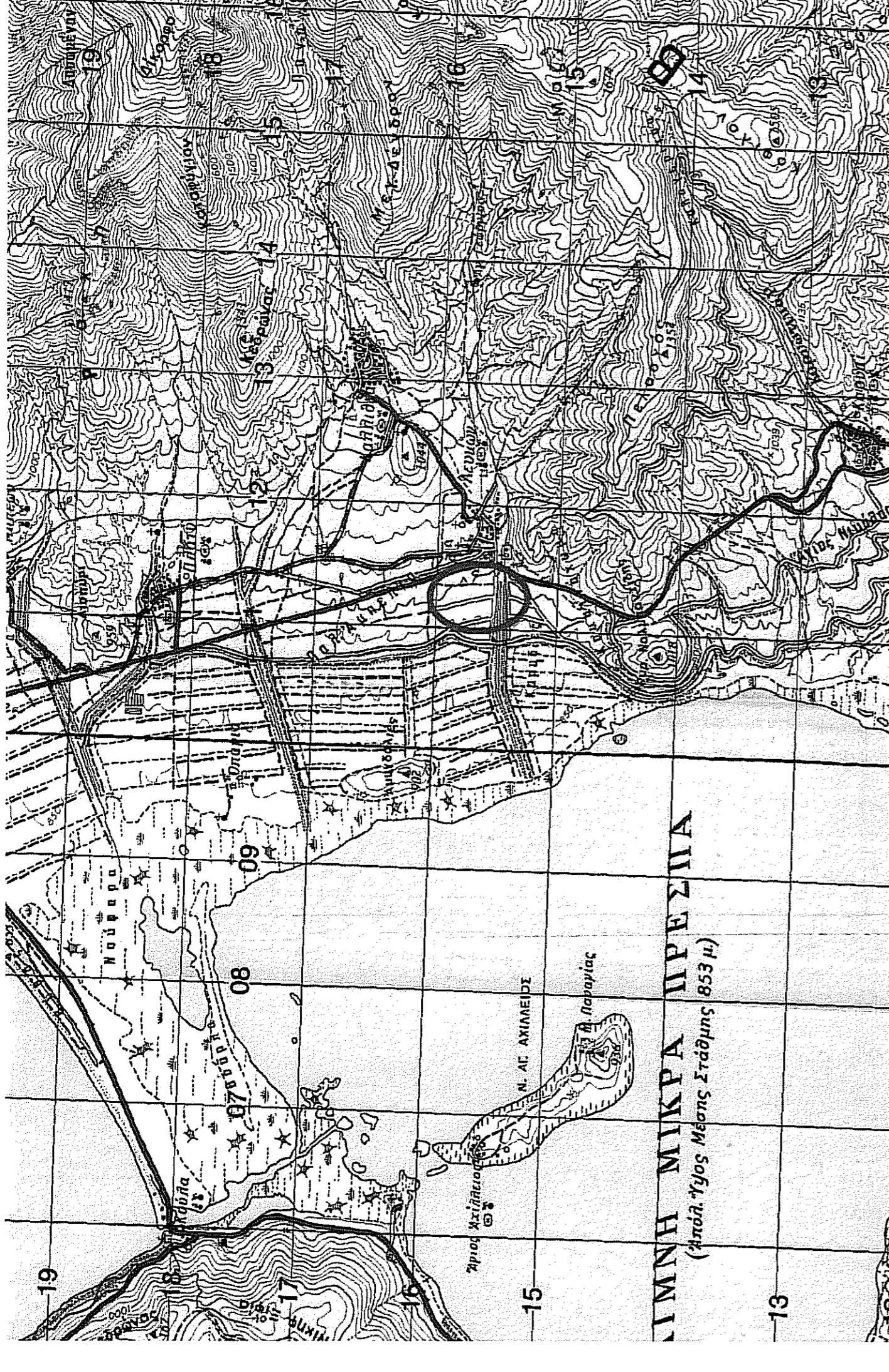
Απόσπασμα χάρτη ΓΣ ΑΝΤΑΡΤΙΚΟ Κλίμακα 1:50.000