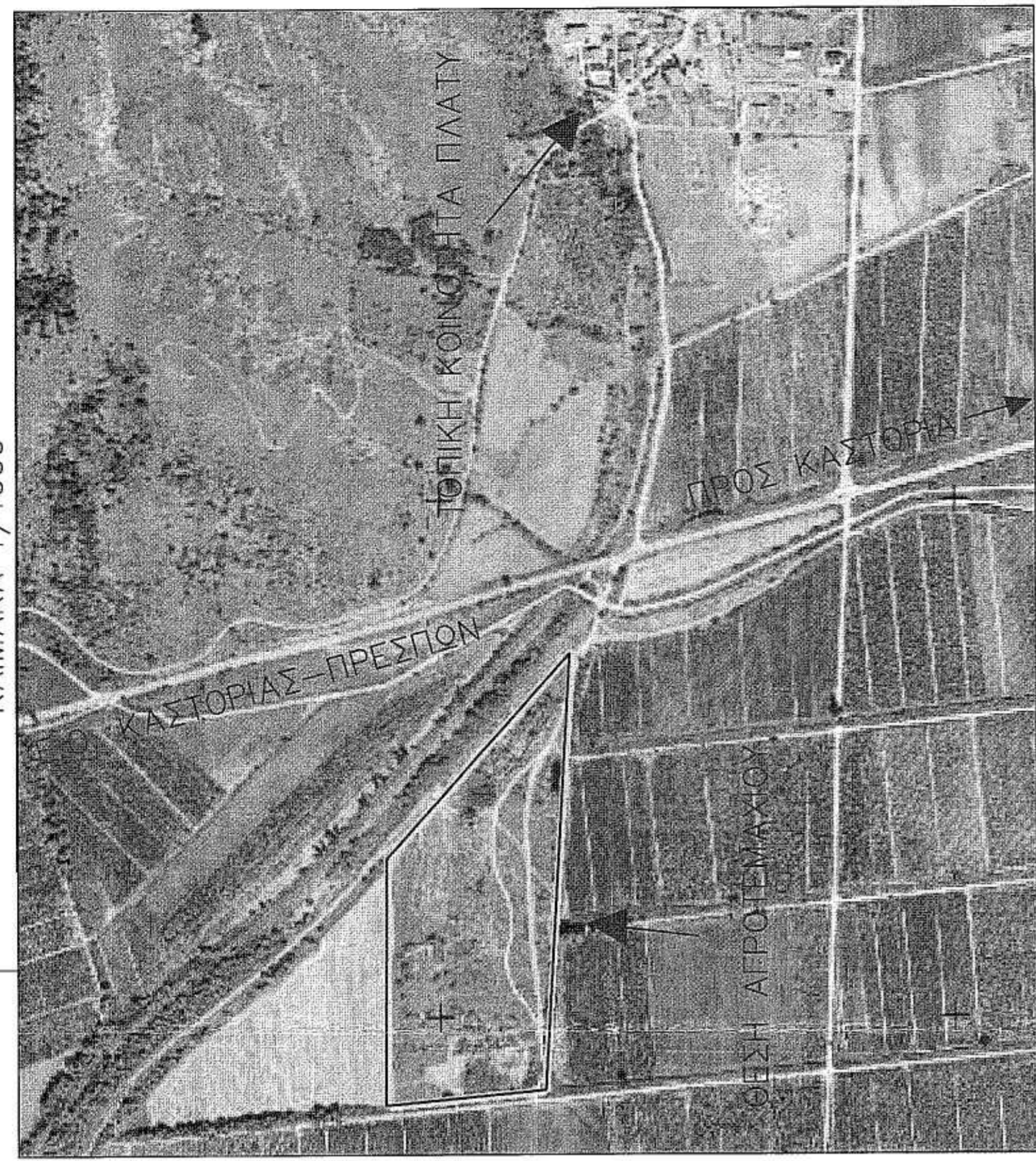
ΑΝΑΛΑΣΜΟΣ ΠΛΑΤΥ(1970) ΚΛΙΜΑΚΑ 1/1000