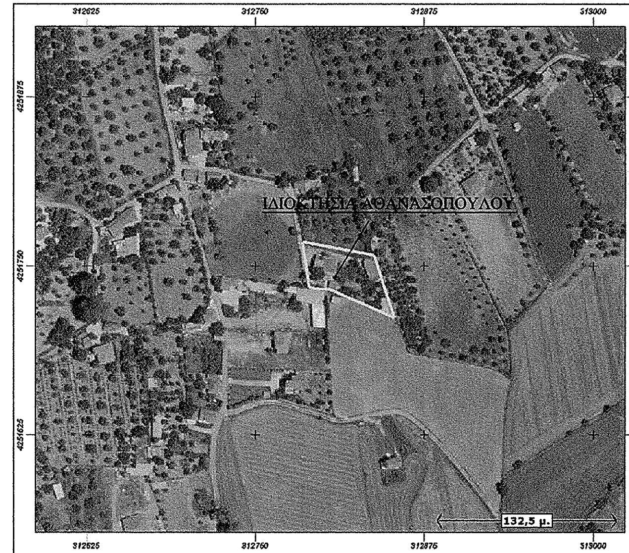
ΑΠΟΣΠΑΣΜΑ ΕΚΧΑ Α.Ε.

ΥΠΟΜΝΗΜΑ ΕΞΑΡΤΗΣΗΣ ΤΟΠΟΓΡΑΦΙΚΟΥ ΔΙΑΓΡΑΜΜΑΤΟΣ Η εξάρτηση από το Ε.Γ.Σ.Α. 87 πραγματοποιήθηκε με παρατηρήσεις που διεξήχθησαν την 30/07/2014 και στο χρονικό διάστημα από 18:30 μ.μ. έως 19:35 μ.μ. κάνοντας χρήση του Σταθμού Αναφοράς Ναυπιάκου του ιδιωτικού Δικτύου (URANUS) της Εταιρείας TREE COMPANY CO ΑΕΒΕ με συντεταγμένες Χ:306017.902, Ψ:4248921.838, Η:11.288m. Το μήκος του διανύσματος βάσης που επιλύθηκε είναι: 7338.77m (απόσταση Σταθμού Αναφοράς από σημείο του οικοπέδου). Η απόδοση έγινε με την μέθοδο της Κινηματικής Μέτρησης Πραγματικού Χρόνου(RTK) και χρησιμοποιήθηκε ο Γεωδαιτικός GNSS Δέκτης GRS1-N της Topcon με Serial Number:824-20013 με ακρίβειες μέτρησης οριζοντιογραφικά:10mm+1.0ppm και υψομετρικά:15mm+1.0ppm. Επίσης για την απόδοση χρησιμοποιήθηκε ο Γεωδαιτικός Σταθμός GTS 105N της Topcon με Serial Number: 6H 5274