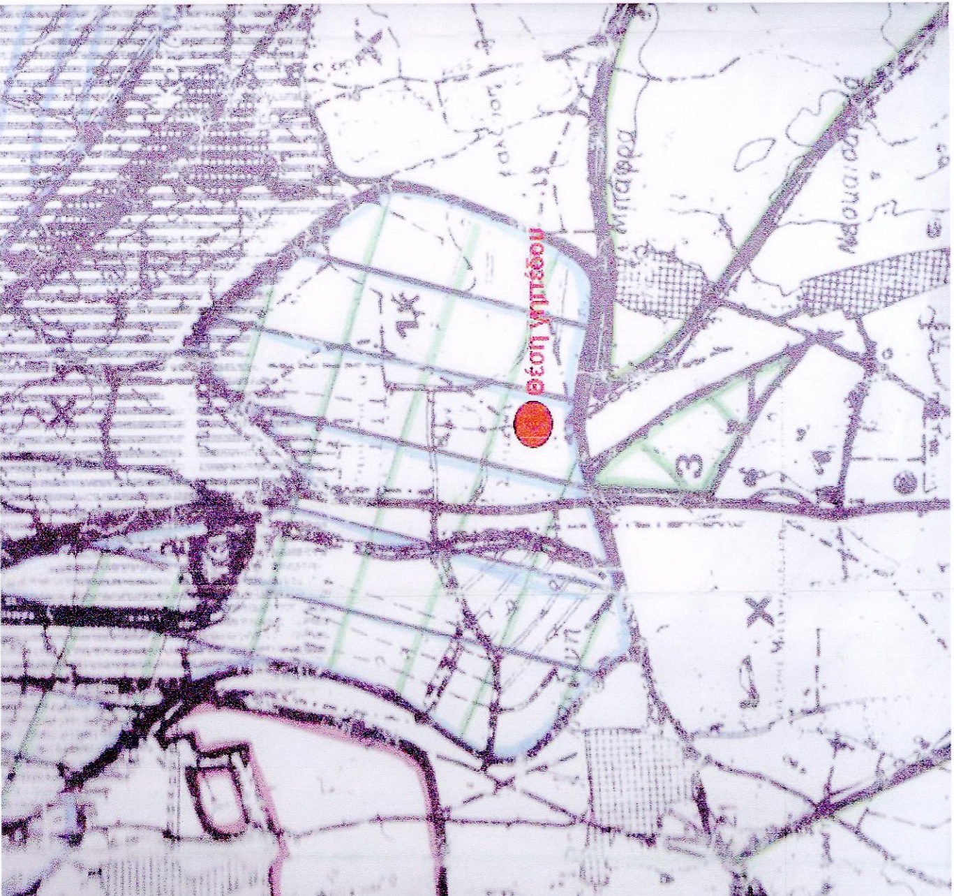
ΑΠΟΣΤΑΣΜΑ ΕΥΡΥΤΕΡΗΣ ΠΕΡΙΟΧΗΣ