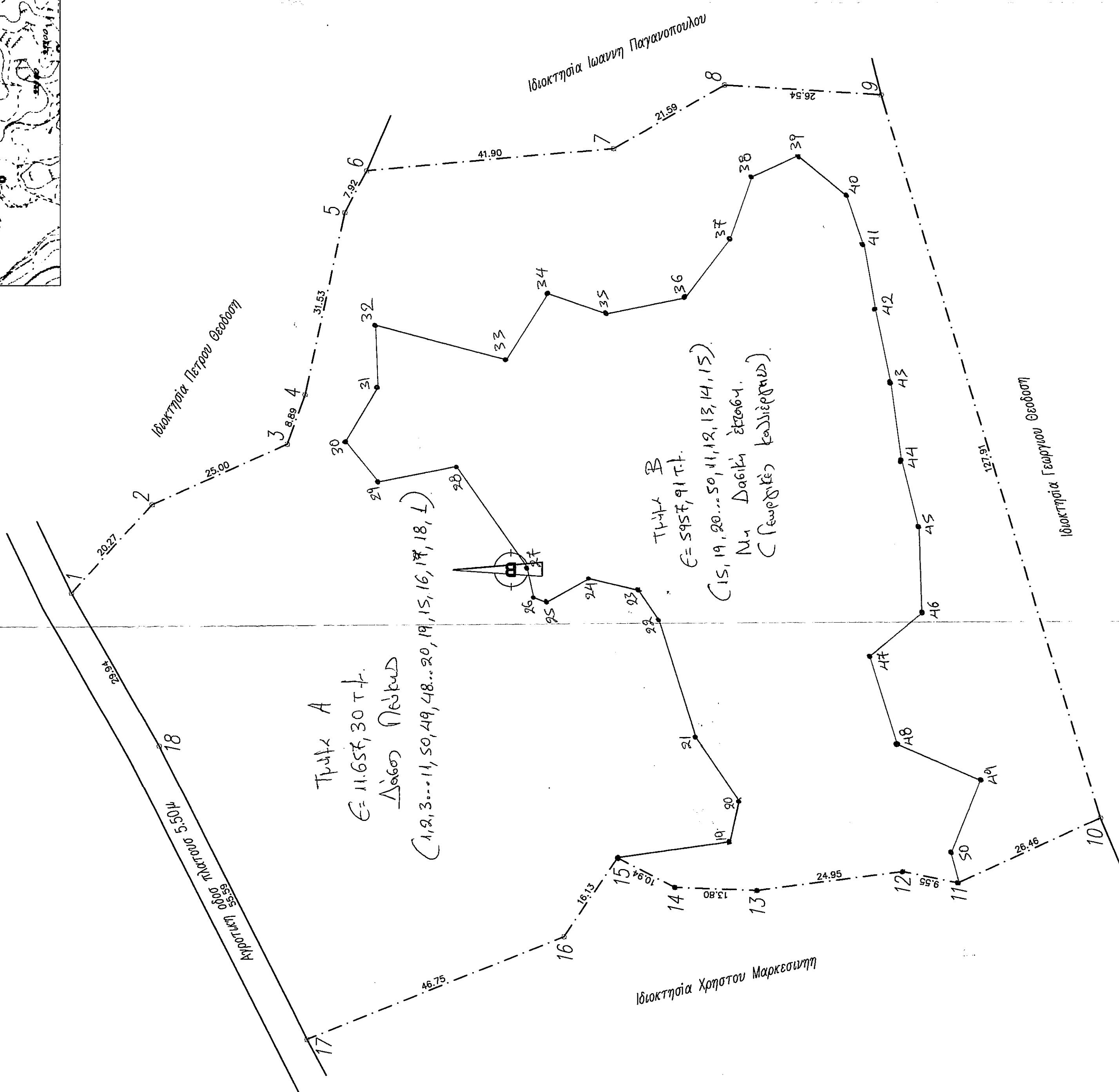
Απόσπασμα χάρτη ΓΥΣ κλίμακα 1:5000