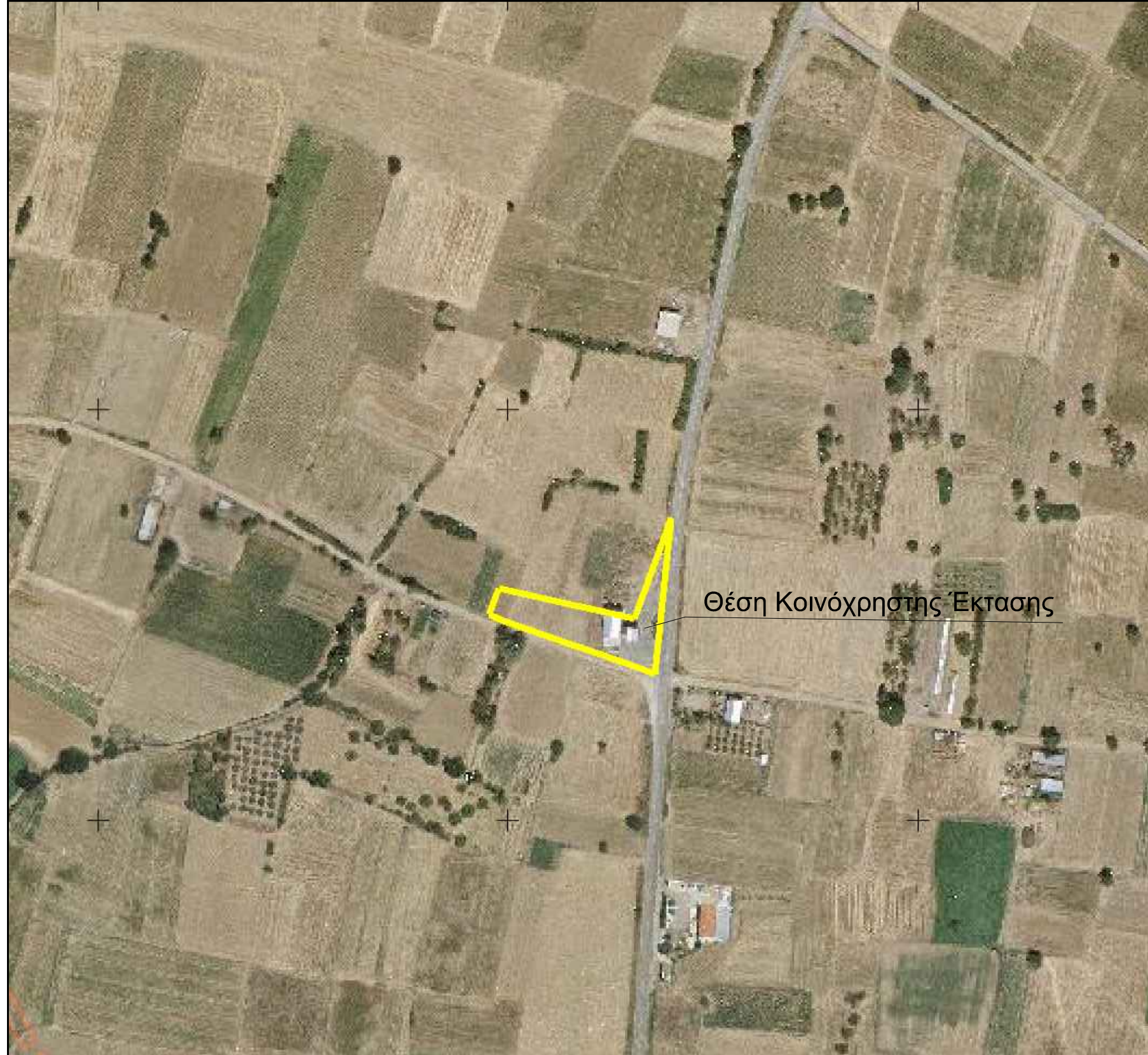
ΑΠΟΣΠΑΣΜΑ ΟΡΘΟΦΩΤΟΧΑΡΤΗ ΕΥΡΥΤΕΡΗΣ ΠΕΡΙΟΧΗΣ