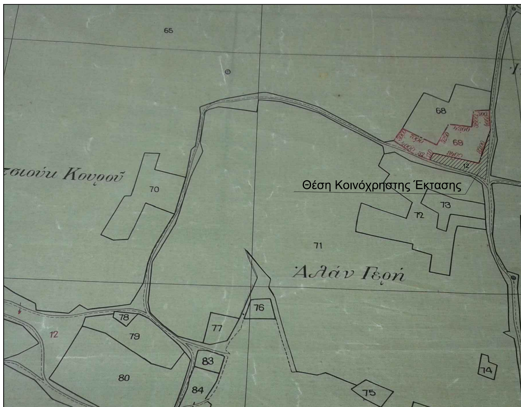
ΑΠΟΣΠΑΣΜΑ ΔΙΑΓΡΑΜΜΑΤΟΣ ΟΡΙΣΤΙΚΗΣ ΔΙΑΝΟΜΗΣ 1930 ΛΥΚΕΙΟΥ