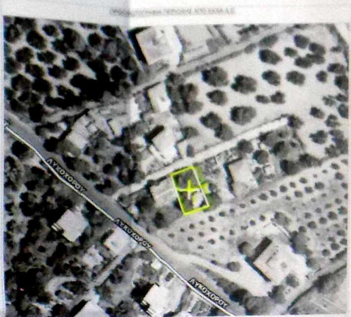
ΑΠΟΣΠΑΣΜΑ ΤΟΥ ΥΠ. ΑΡΙΘΜ. 6925-6 ΧΑΡΤΗΣ Γ.Υ.Ε. ΚΑΙΜΑΚΑ 1/5000