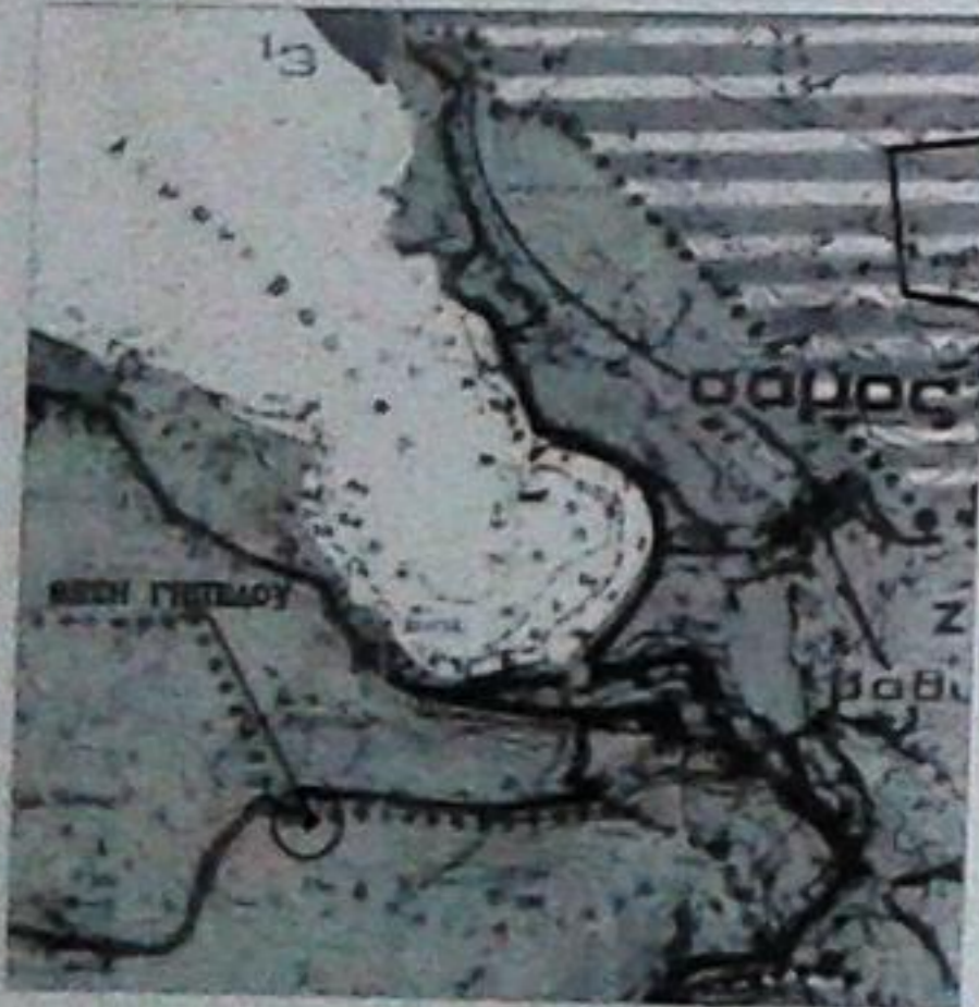
ΑΠΟΣΠΑΣΜΑ ΧΥΡΟΤΑΣΙΑΚΗΣ ΜΕΛΕΤΗΣ