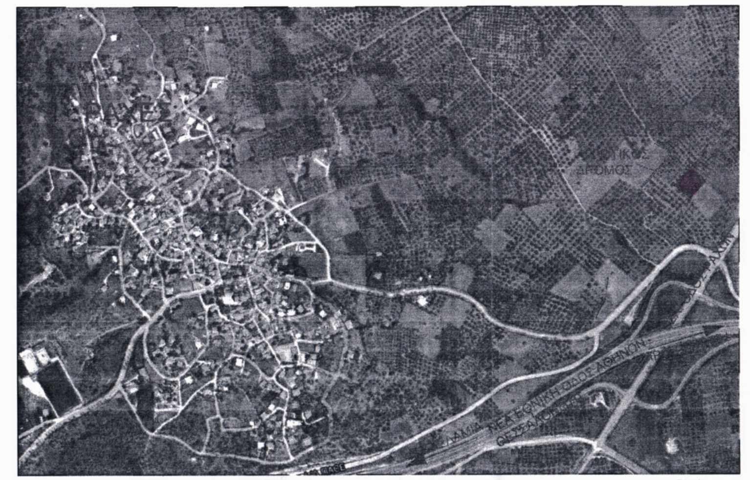
ΑΠΟΣΠΑΣΜΑ ΕΥΡΥΤΕΡΗΣ ΠΕΡΙΟΧΗΣ ΑΝΕΥ ΚΛΙΜΑΚΑΣ

ΠΡΑΞΗ Η έκταση που απεικονίζεται στο παρόν τοπογραφικό διάγραμμα με στοιχεία Α-Β-Γ-Δ-Α και εμβαδό 2.615,23 τ.μ. στη θέση "Καμάρι" του Δήμου Στυλίδας, εμπίπτει στις δ/ε-αρθρου 3 παρ. 6α του Ν. 998/79 (Ν. 30-9-2015) Η Δασολόγος ΘΕΩΡΕΙΤΑΙ και προσαρτάται σε υπ. 1215/48335/2015 έγγραφο με ημερ. 30-09-2015 Η Δασολόγος Ζωή Β. Γεωργίου Δασολόγος