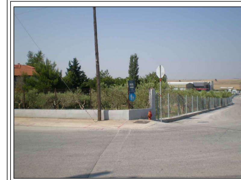
ΦΩΤΟΓΡΑΦΙΑ ΑΠΟ ΘΕΣΗ ΛΗΨΗΣ 2