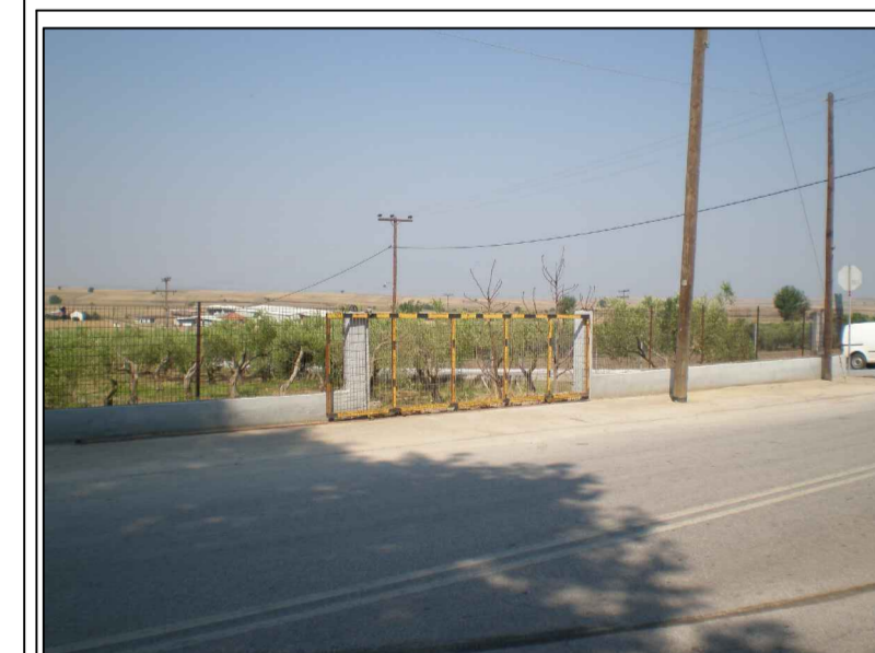
ΦΩΤΟΓΡΑΦΙΑ ΑΠΟ ΘΕΣΗ ΛΗΨΗΣ 3