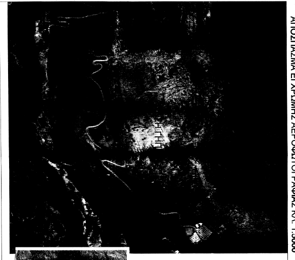
Από αεροχάρτη 1:5000 της κτηματογράφου Ιονίου