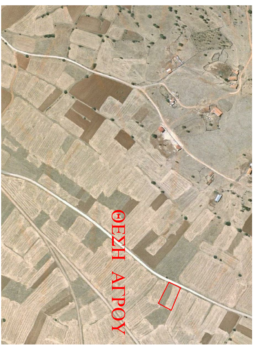
αεροσυστάγραμμα στο κτηματολόγιο