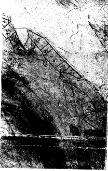
Από απόλ. κλίμακα: 1:5468 της κτηματολογικής μονάδας κωνσταντίνου χατζοπού.