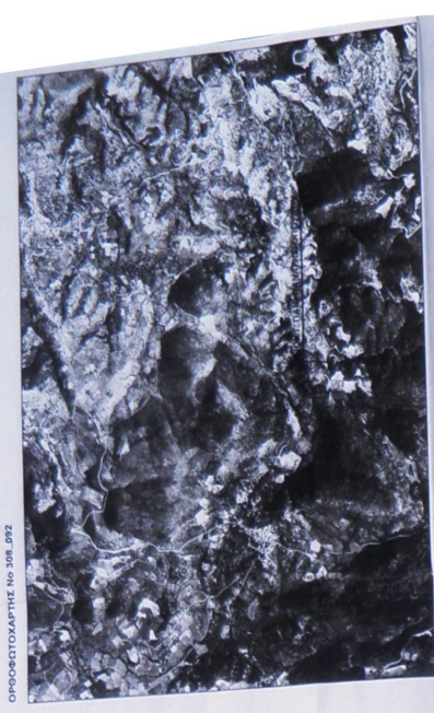
ΟΡΘΟΦΩΤΟΓΡΑΦΗΣ Νο 308_072

ΤΟΠΟΓΡΑΦΙΚΟ ΔΙΑΓΡΑΜΜΑ: εξέλιξης έκτασης με στοιχεία (1,2,3...62,63) επιφανείας 15647.72 τμ. η οποία διέπεται ή όχι από τις διατάξεις της Δασικής Νομοθεσίας.