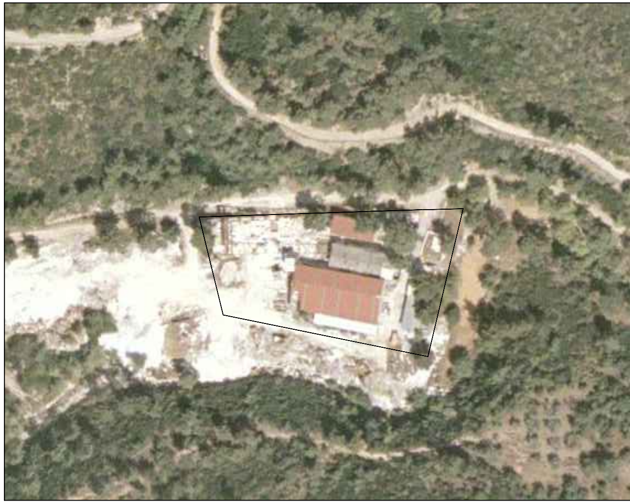
ΑΠΟΣΠΑΣΜΑ ΟΡΘΟΦΩΤΟΧΑΡΤΗ ΚΤΗΜΑΤΟΛΟΓΙΟΥ