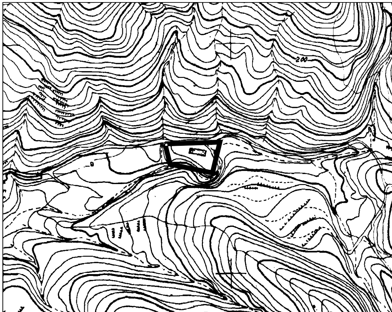
ΑΠΟΣΠΑΣΜΑ ΤΟΠΟΓΡΑΦΙΚΟΥ ΔΙΑΓΡΑΜΜΑΤΟΣ ΓΥΣ 1:5000 3574_3