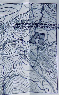
ΑΠΟΣΤΑΣΜΑ ΧΑΡΤΟΥ ΓΥΣ ΦΥΛΛΟ 623/6 ΚΛ 1:5000

ΥΠΟΜΗΝΗΜΑ 1- Επέμβαση γεωμετρικού Ε(1:2,3,4,5,6... — 39,45(4,1,1) = 8125.00μ² 2- Δίπλωμα Μηχανικός. Η υπογεγραμμένη Αθανασία Κωστοπούλου, δηλώνει ότι υπό το στοιχείο (1,2,3,4,5,6... — 39,45(4,1,1)) αγοράστηκε συνιδιοκτησίας Παναγιώτης Παρασκευάσπου και Κώληρος Γεωργίου Παρασκευάσπου στη θέση "Πουρνάρες - Γολέμιοι" του τοπικού διαμερισμού Λεωσίου της Δημοτικής Κοινότητας Φαρρών, του Δήμου Ερυμάνθου, έχει επένδυση Ε=8086.00μ² ευρισκόμενη εκτός σχεδίου πόλεως, εκτός ζώνης, εκτός Ζ.Ο.Ε. και εκτός Γ.Π.Σ. είναι δε αρτο και οικοδομήσιμο σύμφωνα με τις διατάξεις περί εκτός σχεδίου δόμησης. Παρατήρηση: Το αγροτικό ευρισκείται μέσα στην ακτίνα 800μ του οικισμού "Γολέμιοι" σύμφωνα με την υπ'αρ. Χ11966/87 ΦΕΚ 1003/12-10-87 Απόφαση της Νομ. Αρχάς, ομίας βάσει της παρ. 5 του άρθρου 4 του Π.Δ.24-4-85 ΦΕΚ 181δ της 3-5-85 επειδή ταύτο αποκτάται από τον οικισμό "Γολέμιοι" με όριστα χαρτοδρές και βασικές εκτάσεις, θεωρείται ως εκτός οικισμού και οι ευρισκείται εκτός σχεδίου.