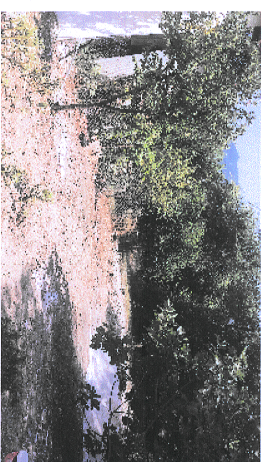
ΦΩΤΟΓΡΑΦΙΑ ΑΠΟ ΘΕΣΗ ΜΗΧΗΣ 2

ΠΑΡΕΛΗ Η έκταση που αναδεικνύεται στο σχέδιο καταρτισμένο σύμφωνα με στοιχεία ΥΠ.Δ.Α. ΚΑΙΝΟΥΡΙΟΥ και αριθμό 319/43, επί της οδού Κολιβαρίου η.μ. ση. ση. Α.Κ. Κολιβαρίου του Δήμου Μυτιλήνης, Α.Κ. Καταρτίστηκε στις 08/08/2015 του άρθρου 3, παρ. 6 του Ν. 998/1978 (νόμος του Κρίσιου 3/4/2005) του Υ.Π.Α. Δ.Δ. ΚΑΙΝΟΥΡΙΟΥ Αβλιούρα Γκρή