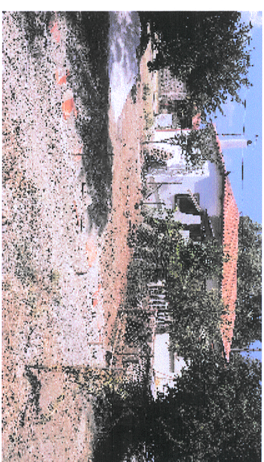
ΦΩΤΟΓΡΑΦΙΑ ΑΠΟ ΘΕΣΗ ΜΗΧΗΣ 1