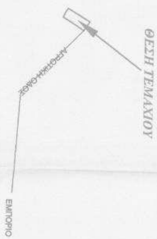
ΟΔΟΤΟΠΙΚΟ ΣΧΗΜΑΤΙΣΜΑ ΚΑΙΜΑΚΑ 1:5000