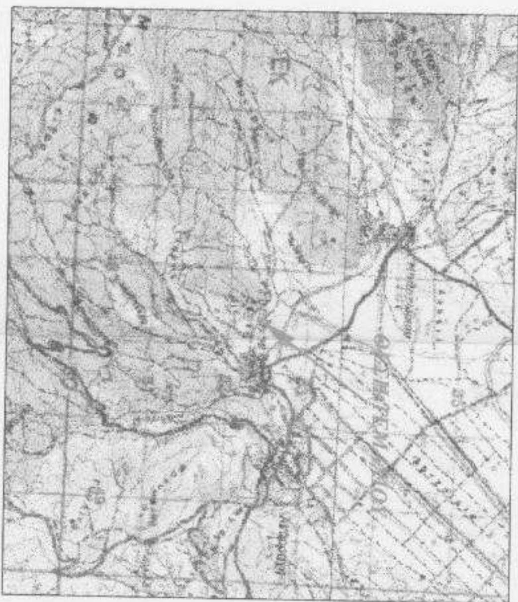
ΑΝΟΙΞΙΜΑ ΧΑΡΤΗ ΓΥΣ "5ΑΤΙΣΤΑ" ΚΑΙΜΑΚΑ 1:5000