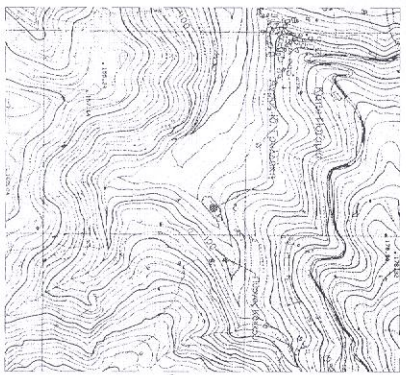
ΑΠΟΤΙΜΑΣΙΑ ΔΙΑΓΡΑΜΜΑΤΟΣ 1:8000 Γ.Υ. Τ.Μ.Ε. 3