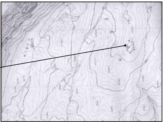
ΑΡΧΙΤΕΚΤΟΝΙΚΑ Σ. ΠΡΟΣ. 1:50.000 Γ.Υ.Σ. Τ.Χ.Ν.Ε.Ρ.Τ. ΚΑΤ' ΕΚΤΑΣΗ ΚΑΜΑΡΙΕΣ