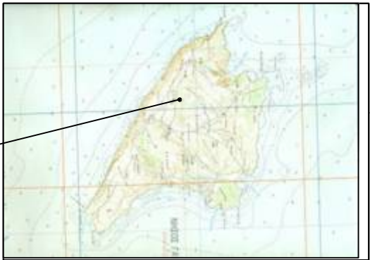
ΑΡΧΙΤΕΚΤΟΝΙΚΑ Σ. ΠΡΟΣ. 1:50.000 Γ.Υ.Σ. Τ.Χ.Ν.Ε.Ρ.Τ.