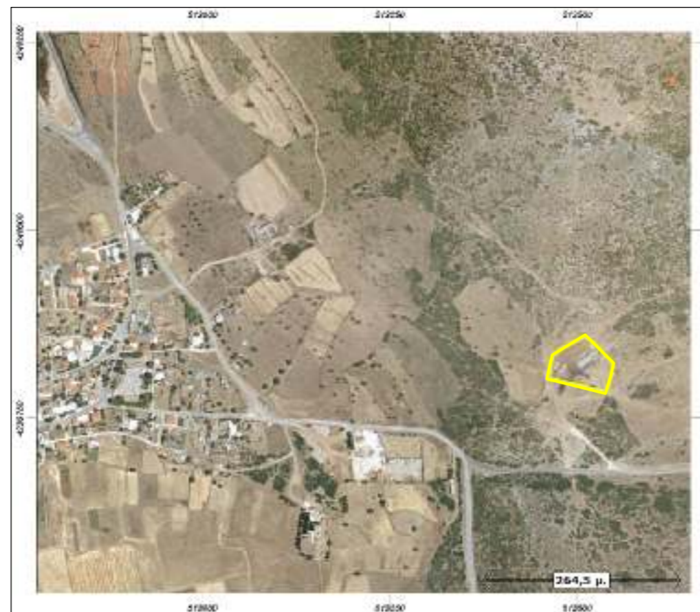
ΑΠΟΣΠΑΣΜΑ ΟΡΘΟΦΩΤΟΓΡΑΦΙΑΣ ΚΤΗΜΑΤΟΛΟΓΙΟΥ

ΠΑΡΑΤΗΡΗΣΗ : Τα όρια τα υπέδειξε ο ιδιοκτήτης.