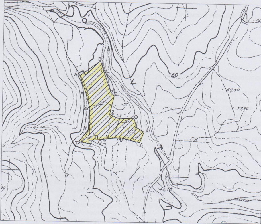
Τοπογραφικό υπόβαθρο Απόσπασμα Φ.Χ. Γ.Υ.Σ. 6487/2 κλιμ. 1:5.000 στην οποία απεικονίζεται η θέση έκτασης

Έκταση εμβαδού 20,500 στρ. με στοιχεία κορυφών περιμέτρου Α,Β,Γ,Δ,Ε,Ζ,Η,Θ,Ι,Κ,Λ,Μ,Ν,Ξ,Ο,Π,Ρ,Σ,Τ,Υ,Φ,Χ,Α στη θέση "Κόντι-Κουκιά" Δημοτικής Ενότητας Κερατέας περιφέρειας του Δήμου Λαυρεωτικής Νομού Αττικής