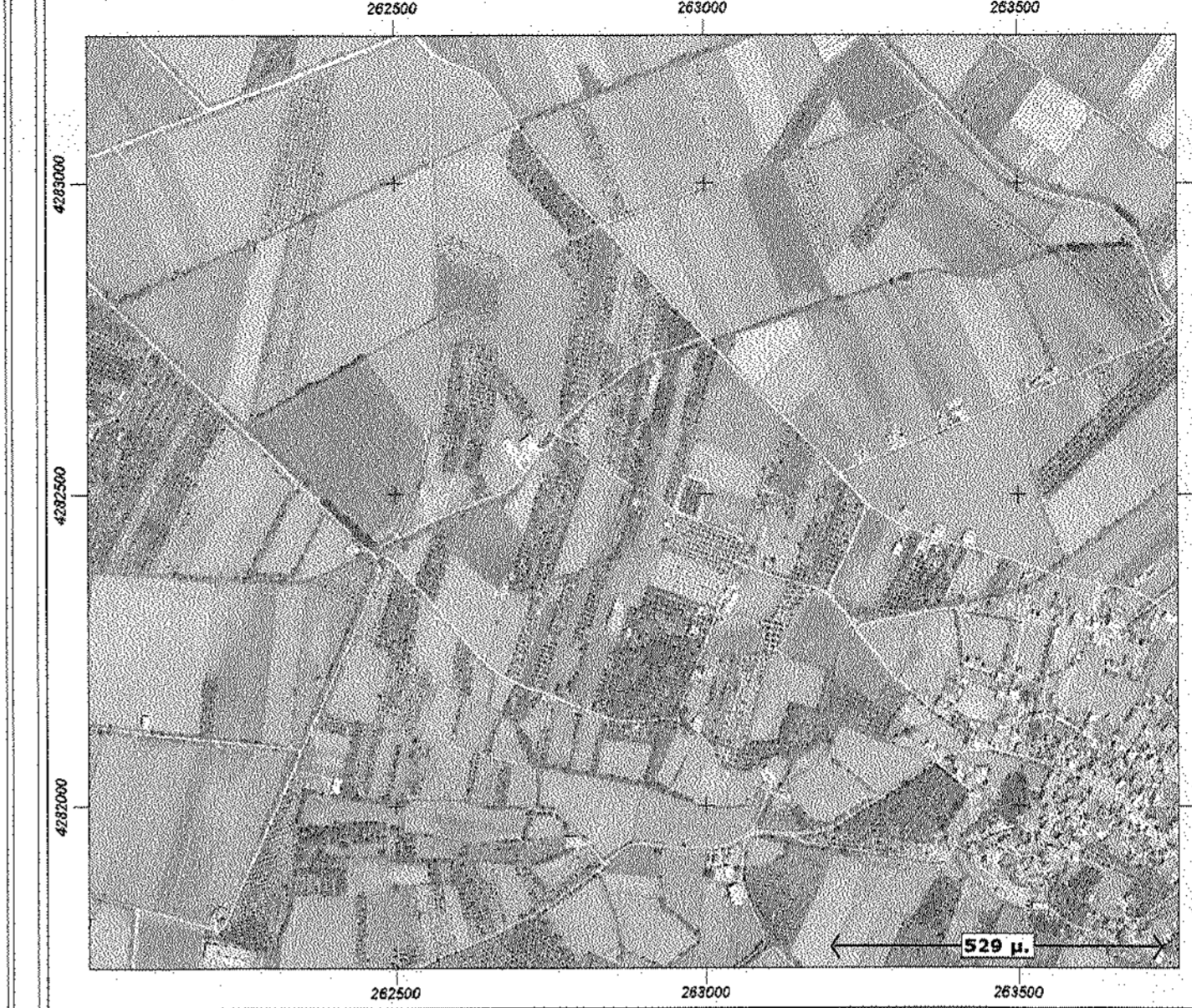
Απόσπασμα χάρτη Εθνικού Κτηματολογίου