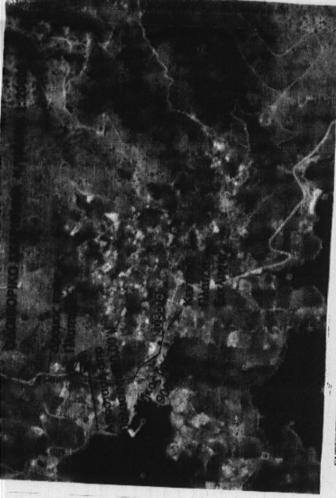
ΣΥΣΧΕΤΙΣΗ ΤΟΥ ΑΚΙΝΗΤΟΥ ΜΕ ΑΠΟΣΠΑΣΜΑ ΤΟΥ ΚΥΡΩΜΕΝΟΥ ΔΙΑΓΡΑΜΜΑΤΟΣ ΔΙΑΝΟΜΗΣ "ΣΥΒΟΤΑ-ΒΡΑΧΩΝΑΣ" (ΘΥΑΜΙΔΟΣ) ΣΥΜ/ΚΗ ΔΙΑΝΟΜΗ 1963-66- ΚΑΙΜΑΚΑ 1:5000