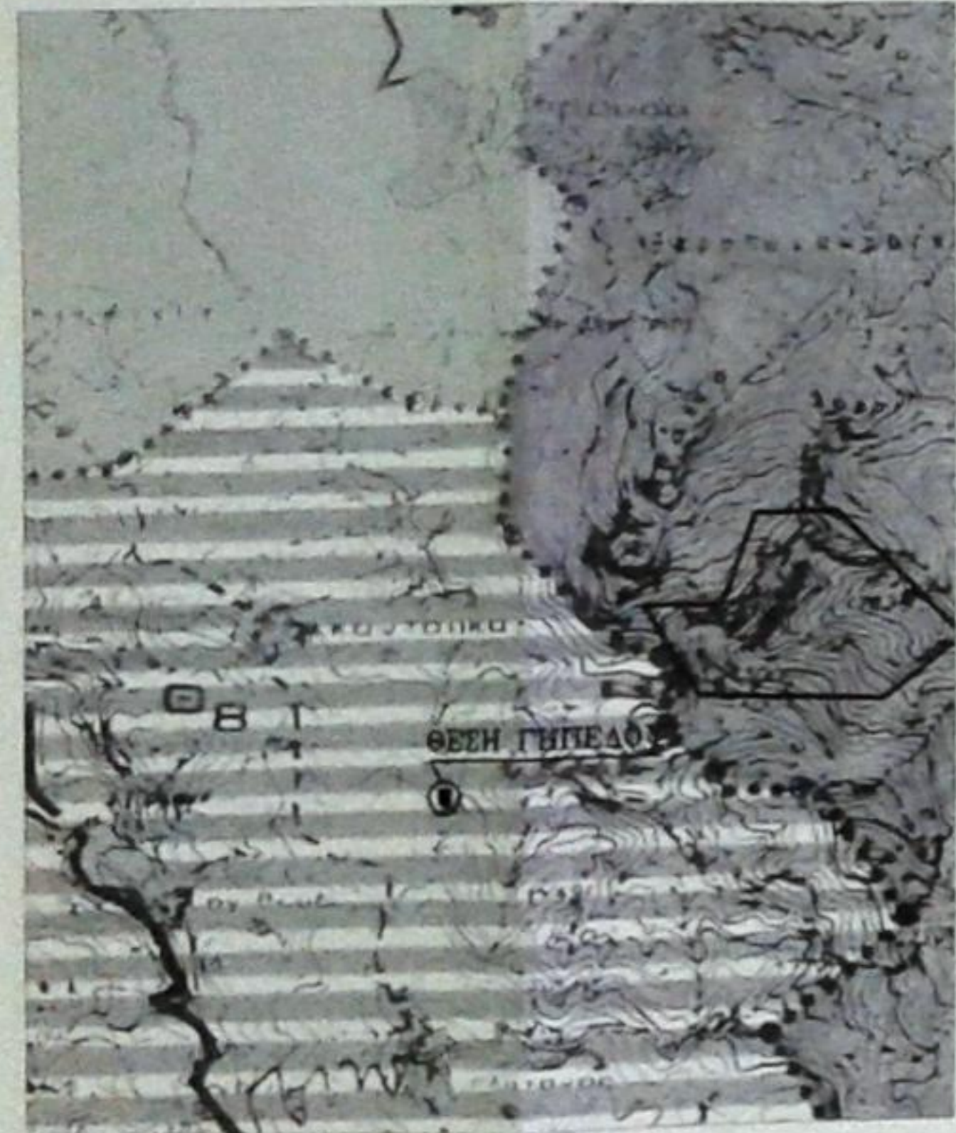
ΑΠΟΣΠΑΣΜΑ ΧΩΡΟΤΑΞΙΚΗΣ ΜΕΛΕΤΗΣ

ΕΥΑΓΓΕΛΟΣ Β. ΛΕΟΝΤΙΔΗΣ ΔΙΠΛΩΜ ΠΟΛΙΤΙΚΟΣ ΜΗΧΑΝΙΚΟΣ ΕΔΕ ΕΘΝΙΚΟΥ ΜΕΤΣΟΒΙΟΥ ΠΟΛΥΤΕΧΝΕΙΟΥ ΜΕΛΟΣ Τ.Ε.Ε. ΑΡΙΘΜΟΣ ΠΡΩΤΟΚΟΛΛΟΥ 50350 ΛΥΚ. ΛΟΓΟΘΕΤΗ 64 ΣΑΜΟΣ ΤΗΛ. 22730 27527