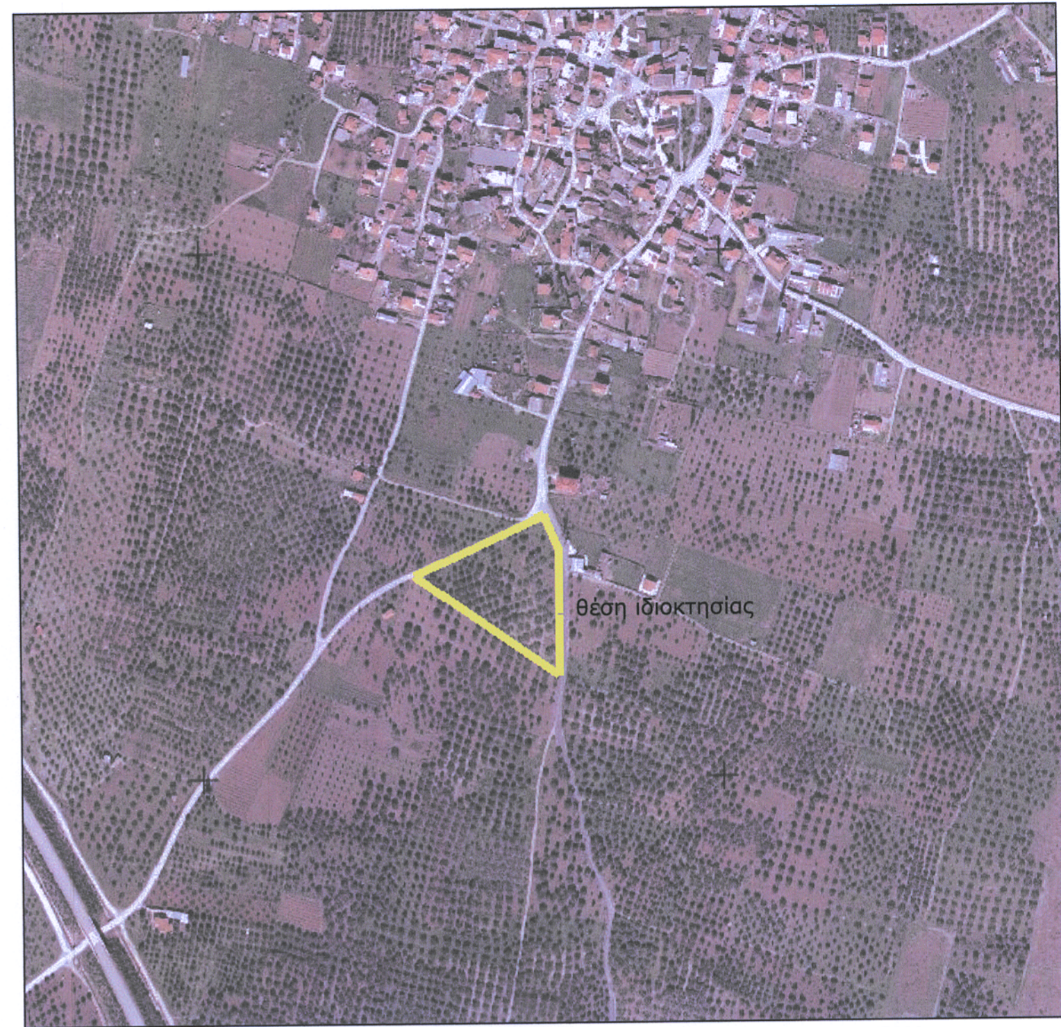
ΑΠΟΣΠΑΣΜΑ ΑΕΡΟΦΩΤΟΓΡΑΦΙΑΣ ΚΤΗΜΑΤΟΛΟΓΙΟΥ Α.Ε. κλ. 1/5000

ΘΕΩΡΕΙΤΑΙ και προσαρτάται ως αριθ. 92/3667/12-1-2016 αριθ. 15-01-2016 Η Δ/ν Δασόφυλας Ε. Γεωργίου Δασολόγος