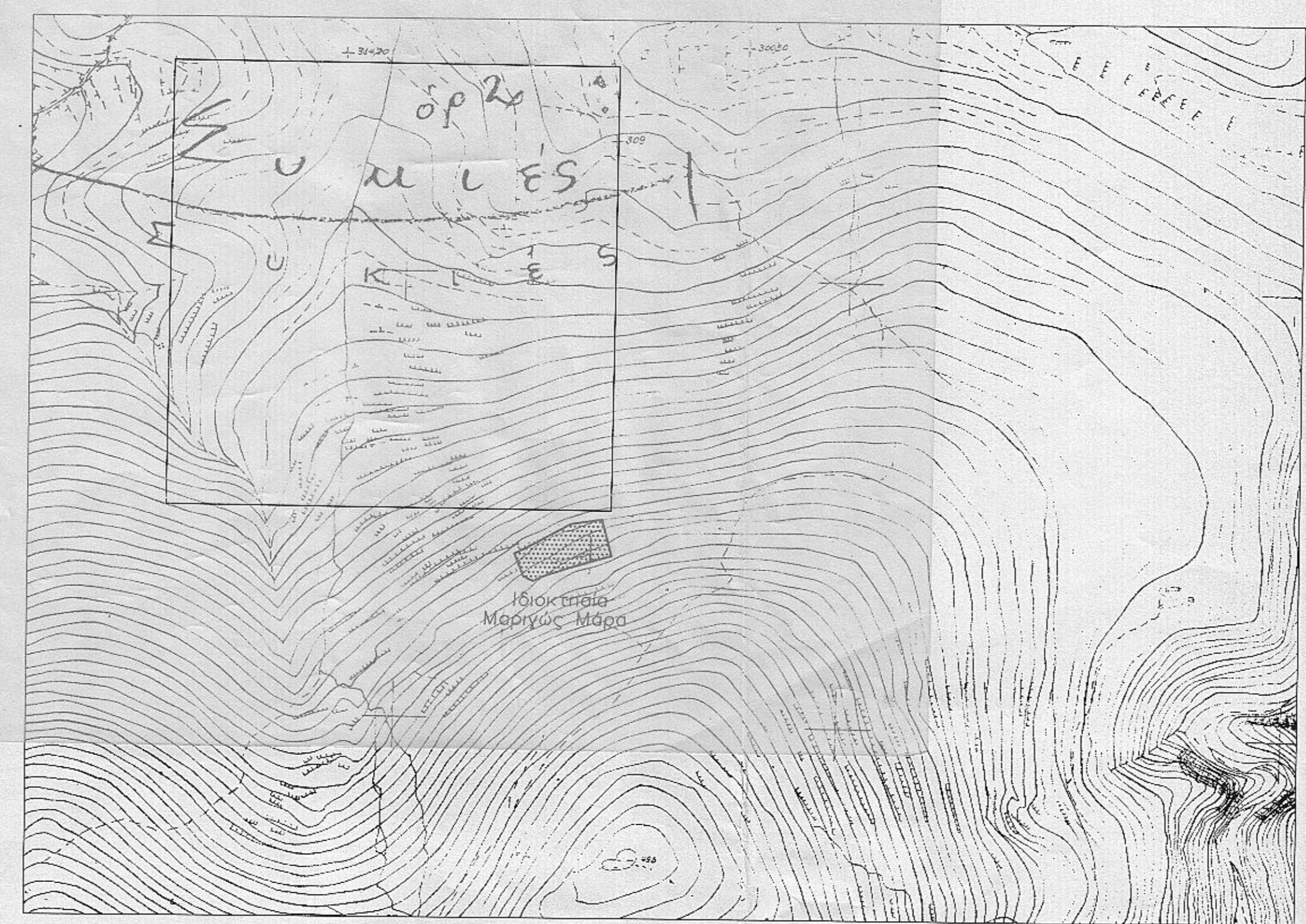
ΑΠΟΣΠΑΣΜΑ ΧΑΡΤΗ Γ.Υ.Σ ΚΛ. 1 : 5000 (Αριθμός Φύλλου 63981)