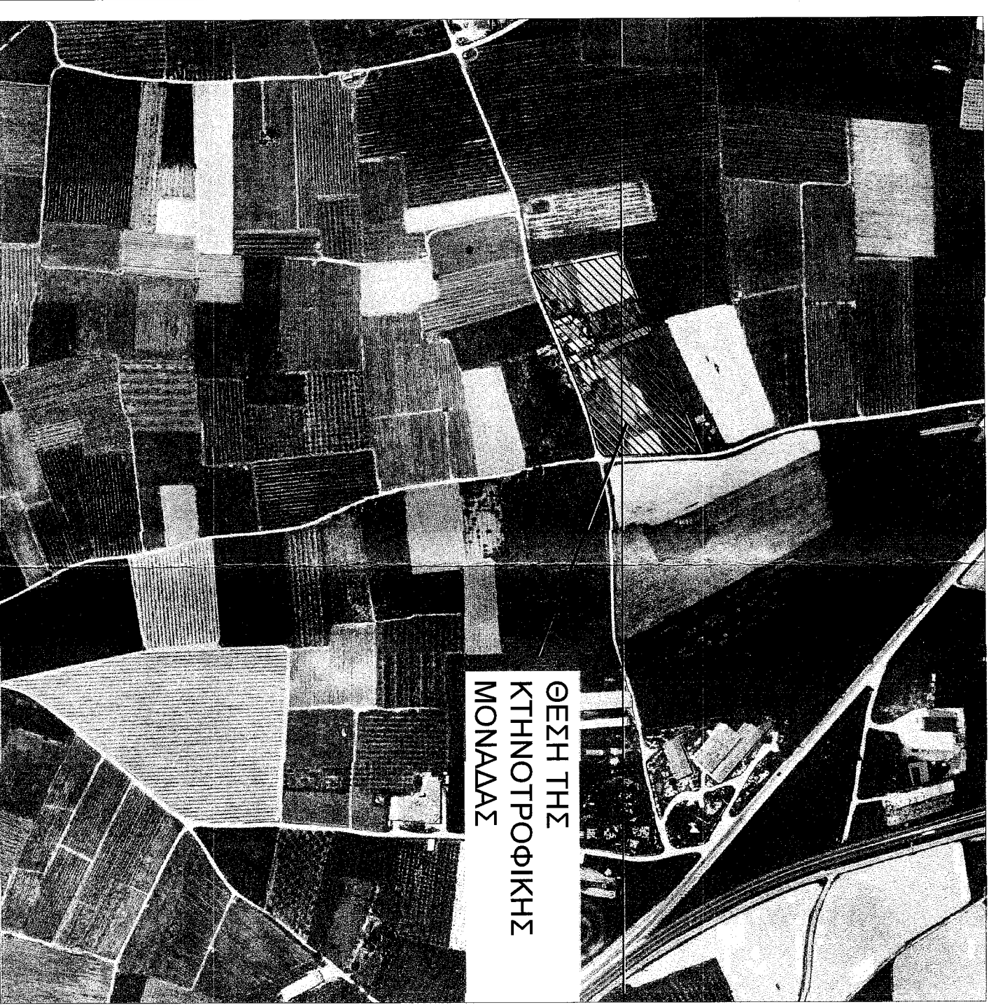
Αντίστοιχα ορθοφωτοαεροφωτογράφημα κλίμακας 1:5.000