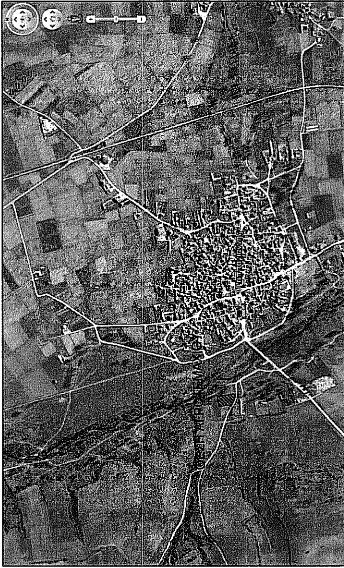
ΑΠΟΣΠΑΣΜΑ ΧΑΡΤΗ ΓΥΣ 1:5000 3262.6