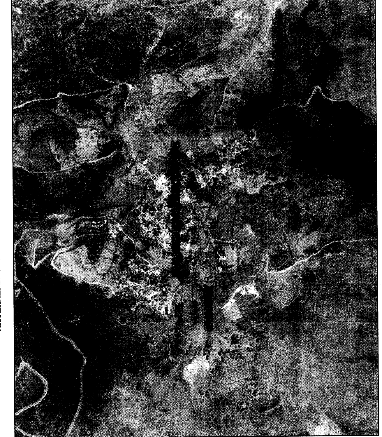
ΑΠΟΠΣΑΣΜΑ ΟΡΘΟΦΩΤΟΧΑΡΤΗ ΚΤΙΡΜΑΤΟΛΟΓΟΥ