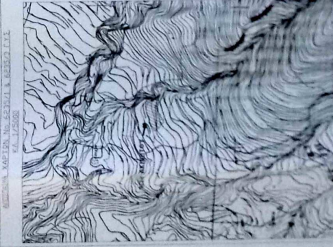
ΑΝΤΙΚΕΙΜΕΝΟ: ΜΕΤΡΗΣΗ ΜΕ 52 ΠΑΛΛΑΚΕΣ ΚΑΙ 623300 Ε.Υ.Ε. 1/6 - 1/25000