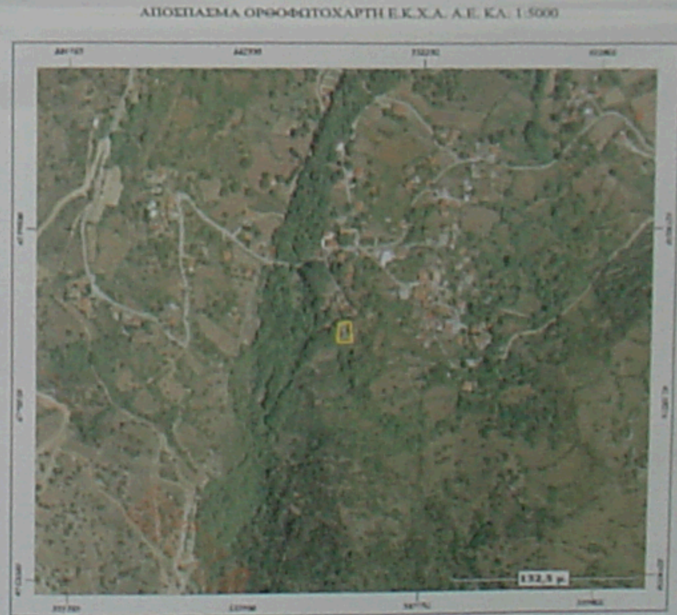
ΑΠΟΣΠΑΣΜΑ ΟΡΘΟΦΩΤΟΧΑΡΤΗΣ Ε.Κ.Χ.Α. Α.Ε. ΚΑ. 1:5000