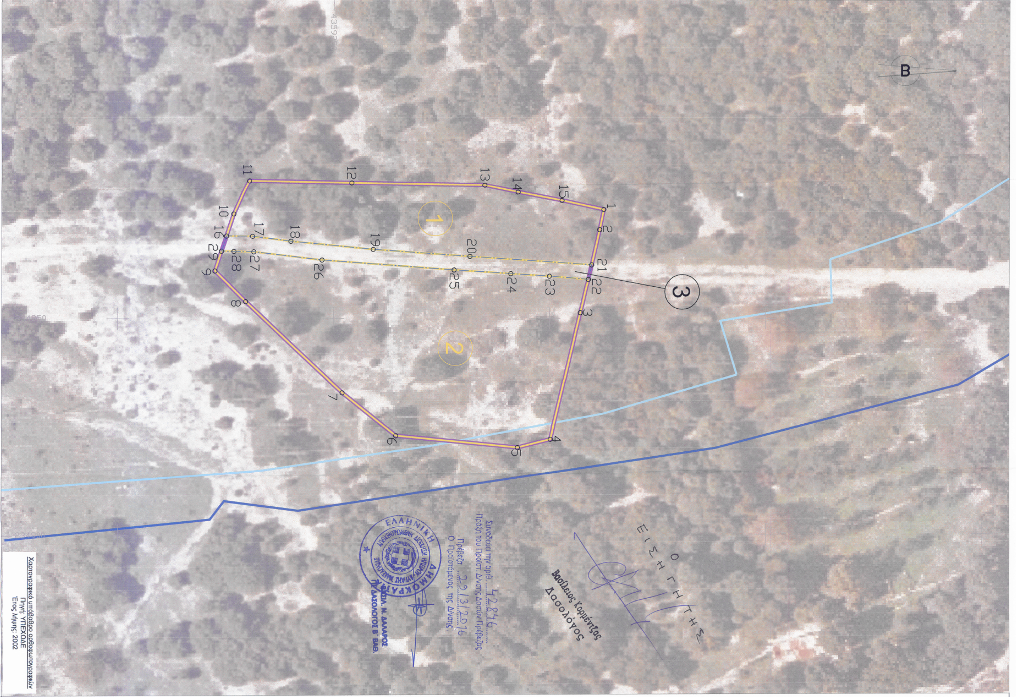
ΠΙΝΑΚΕΣ ΣΥΝΤΕΤΑΓΜΕΝΩΝ ΚΟΡΥΦΩΝ (ΕΓΣΑ 87)