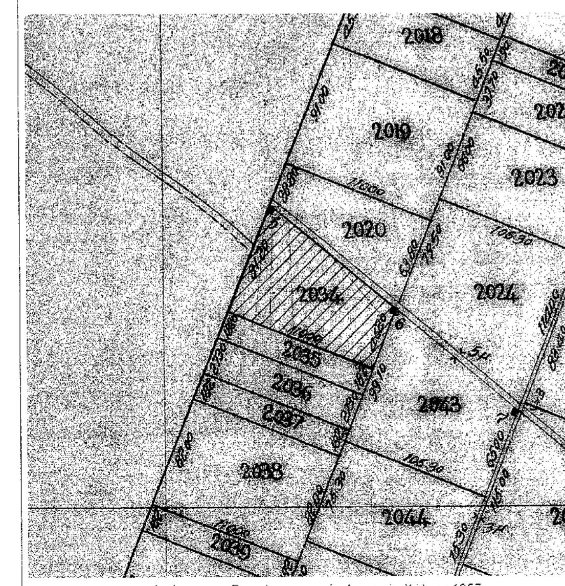
Απόσπασμα Συμπληρωματικής Διανομής Χαλκίδας 1957