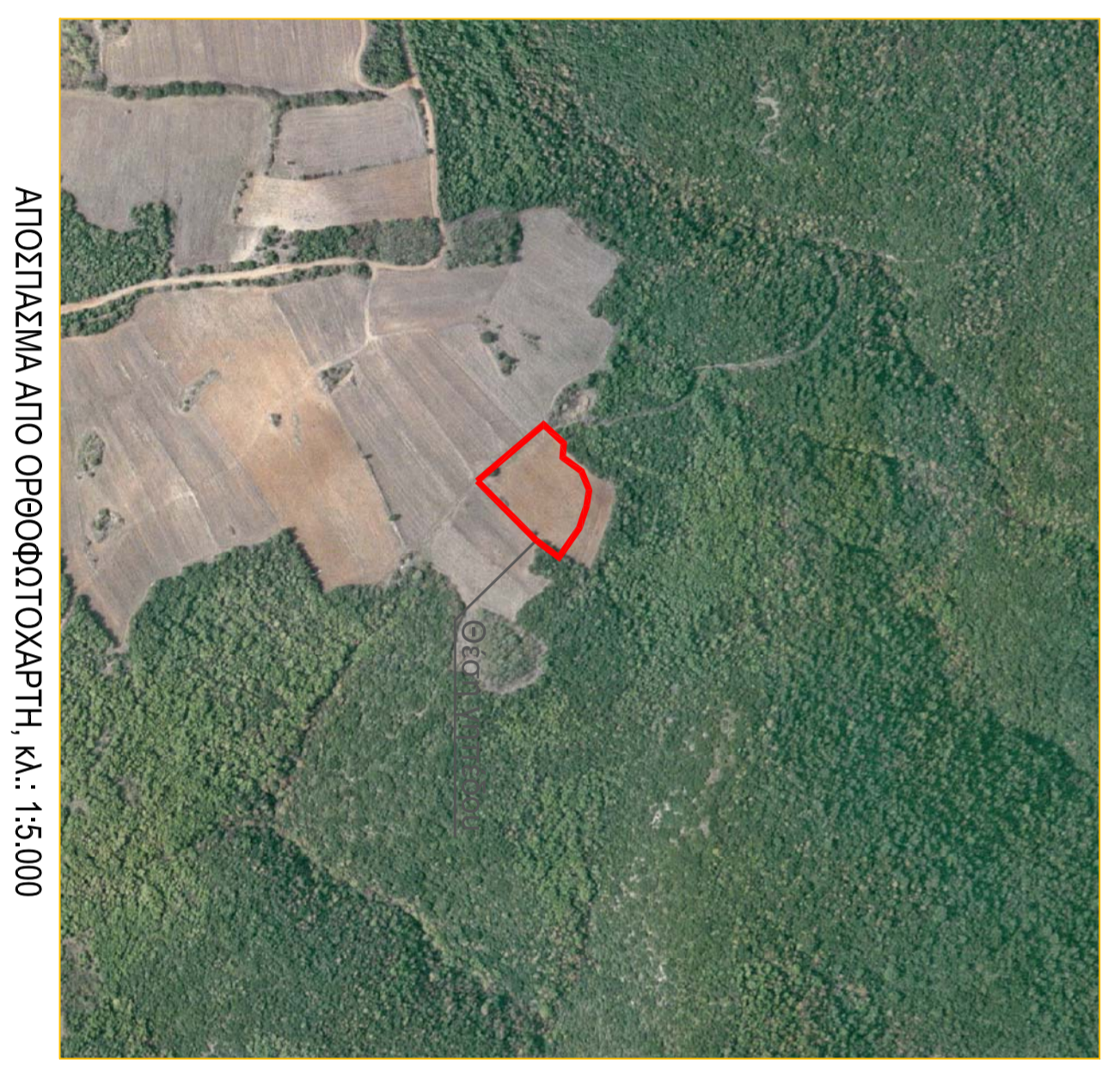
ΑΠΟΣΤΑΣΜΑ ΑΠΟ ΟΡΘΟΦΩΤΟΧΑΡΤΗ, ΚΛ.: 1:5.000