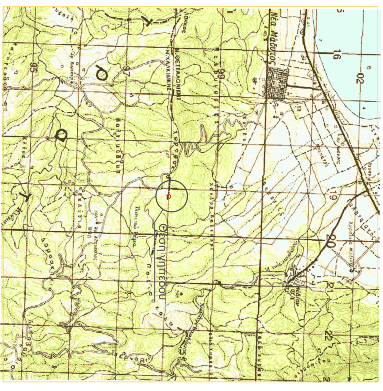
ΑΠΟΣΤΑΣΜΑ ΑΠΟ ΧΑΡΤΗ Γ.Υ.Σ., ΚΛ.: 1:50.000 Φ.Ε.Χ. ΣΤΑΒΟΥ