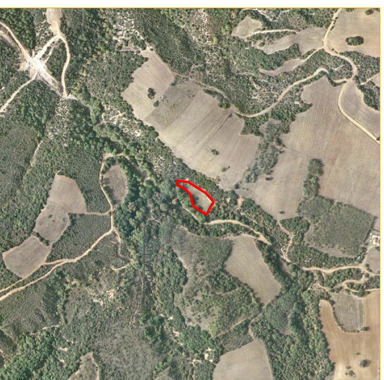
ΑΠΟΣΤΑΣΜΑ ΑΠΟ ΟΡΘΟΦΩΤΟΧΑΡΤΗ, ΚΛ.: 1:5.000