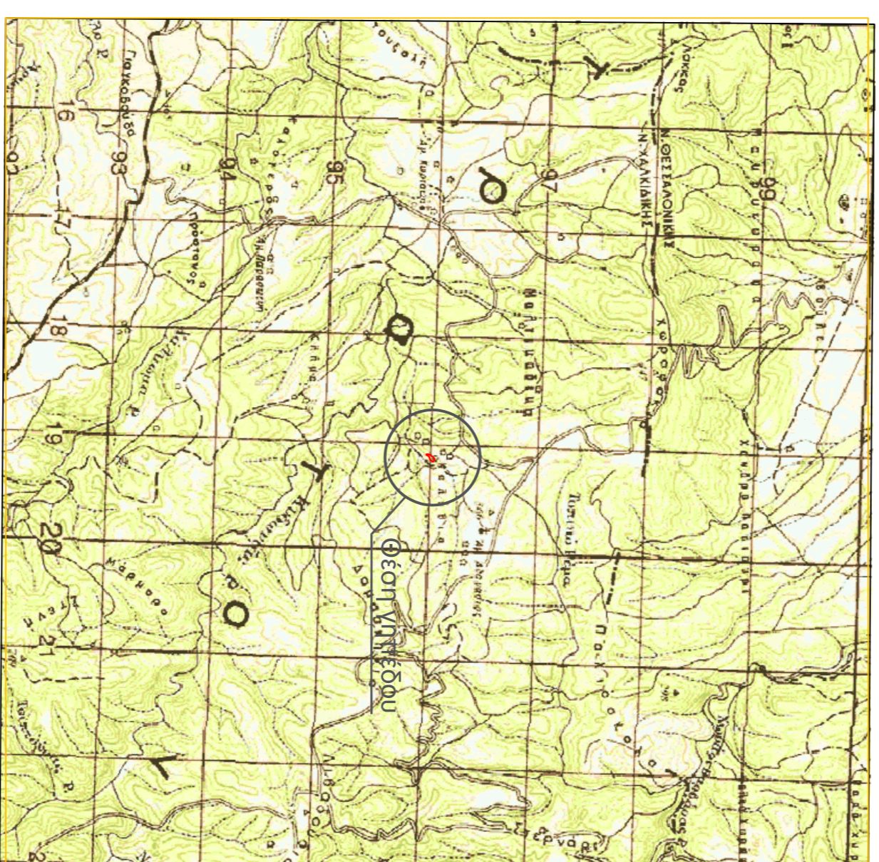
ΑΠΟΣΤΑΣΜΑ ΑΠΟ ΧΑΡΤΗ Γ.Υ.Σ., ΚΛ.: 1:50.000 Φ.Ε.Χ. ΣΤΑΥΡΟΥ